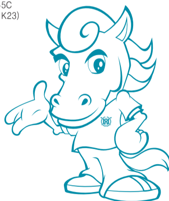
KNSU Peacock Green Pantone 3145C (C100, Y19, K23)