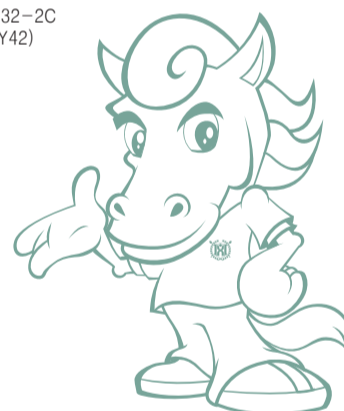
Pantone P 132-2C (C57, M23, Y42)